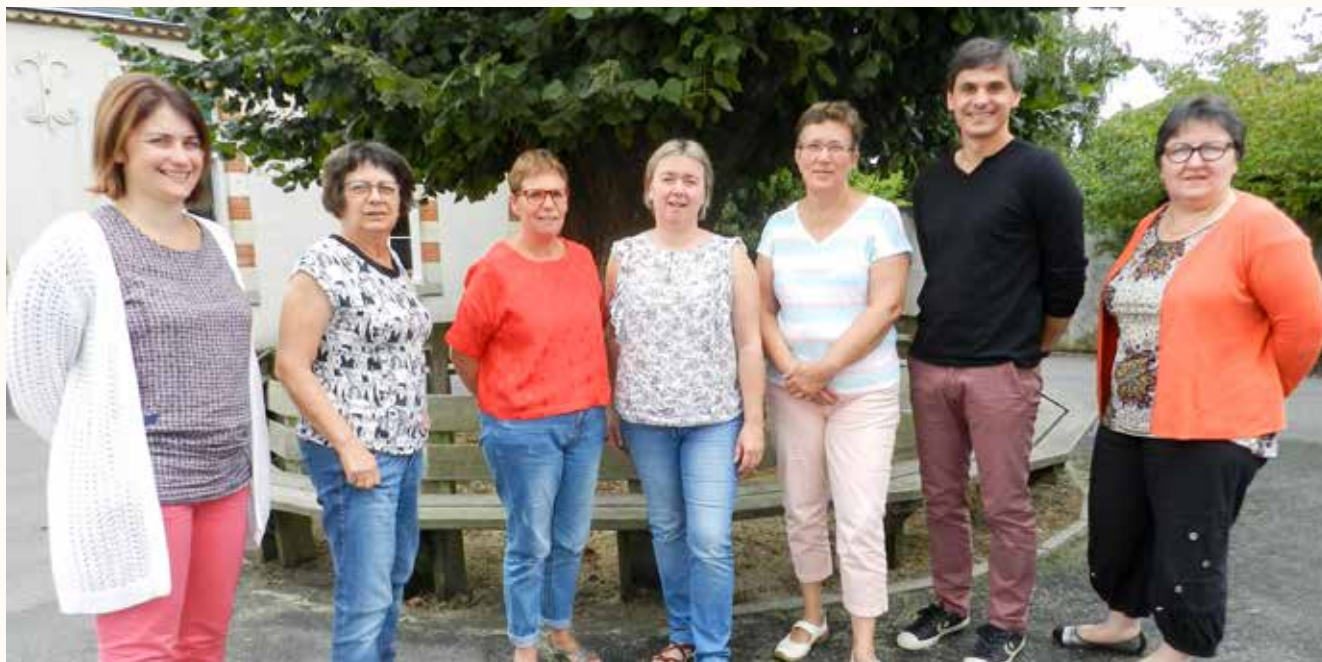
L'équipe pédagogique et éducative des écoles Saint Sauveur et Saint Melaine

L'école Saint Sauveur est en R.P.I. (Regroupement Pédagogique Intercommunal) avec l'école Privée Saint Méline du Tablier.