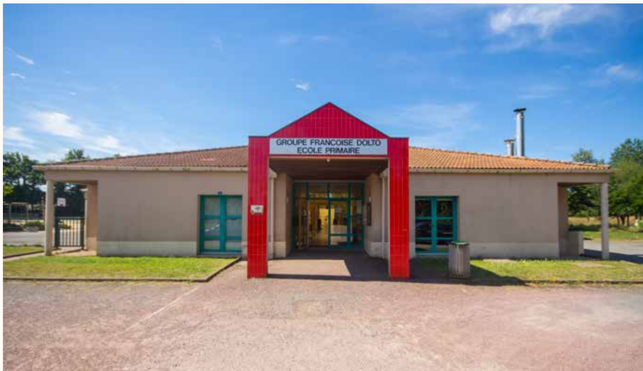
L'école élémentaire Françoise Dolto