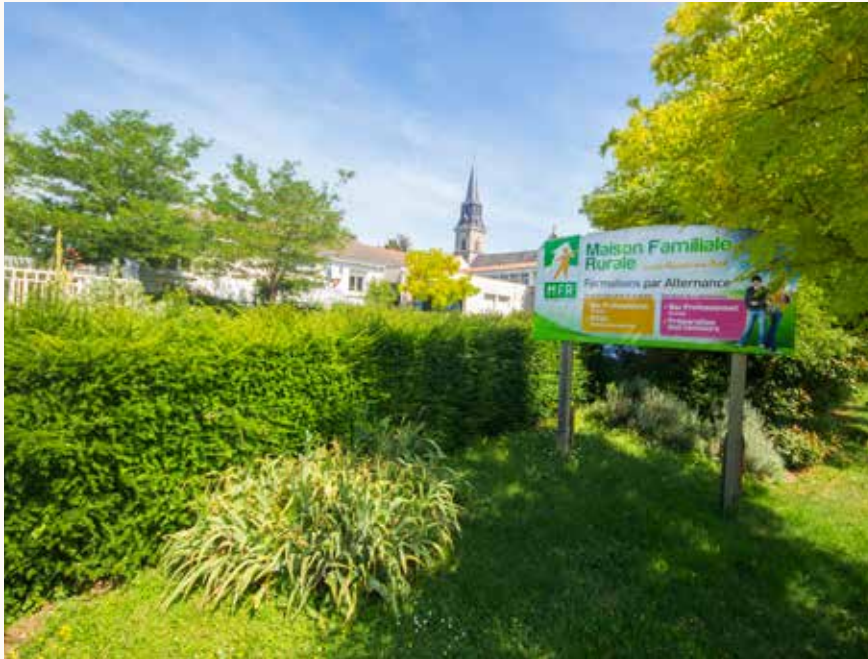
La Maison Familiale Rurale

Les formations évoluent. Un dossier a été déposé pour que le BTS Technico-commercial puisse être dispensé en apprentissage. Un Bac TCV en un an pour les personnes déjà bachelières, développé depuis plusieurs années et maintenant connu, fait le plein de jeunes (19 inscrits pour 2017/2018).