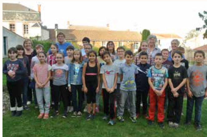
Les 24 élus du CIE

Les communes de Rives de l'Yon et du Tablier viennent de signer une convention validant la création d'un Conseil Intercommunal des Enfants Rives de l'Yon/Le Tablier. C'est désormais un Conseil unique qui représente les enfants du territoire.