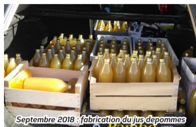
Septembre 2018 : fabrication du jus de pommes

L'argent collecté tout au long de l'année permet de financer différents projets de l'école (sorties scolaires par exemple). L'association organise différentes actions tout au long de l'année.