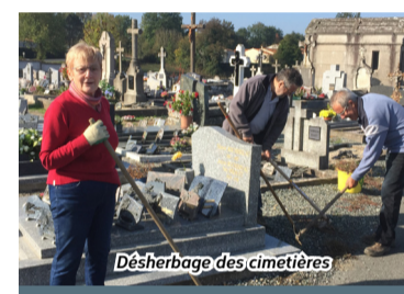
Désherbage des cimetières

Le Conseil des Sages envisage également de réaliser une mise à niveau pour « les gestes qui sauvent » en liaison avec la Protection Civile.