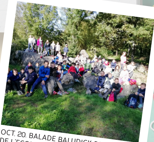
OCT. 20. BALADE BALUDICK DES ÉLÈVES DE L'ÉCOLE ST SAUVEUR