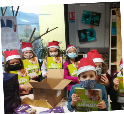
14.12.20. LES ÉLÈVES DE L'ÉCOLE DE LA VALLÉE DE L'YON DÉCOUVRENT LEURS TIERS CADEAUX.