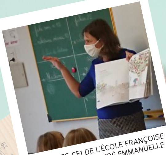
12.12.20. LES CEI DE L'ÉCOLE FRANÇOISE DOLTO ONT RENCONTRÉ EMMANUELLE HOUSSAIS, ILLUSTRATRICE.