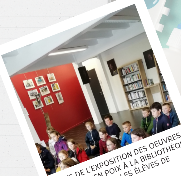
VISITE DE L'EXPOSITION DES OEUVRES DE SÉBASTIEN POIX À LA BIBLIOTHÈQUE DU TABLIER POUR LES ÉLÈVES DE L'ÉCOLE ST SAUVEUR.