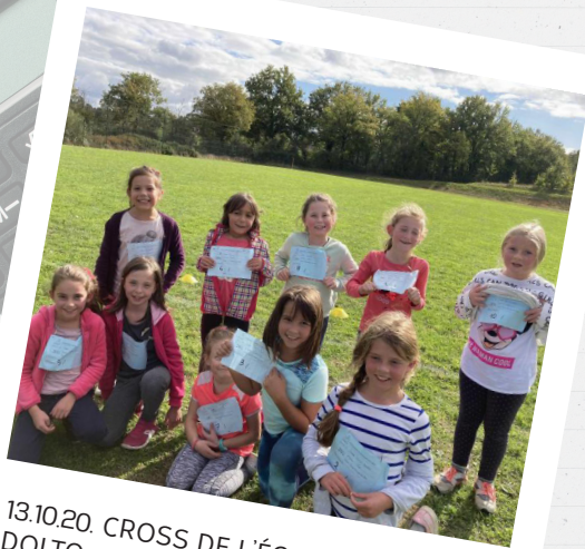
13.10.20. CROSS DE L'ÉCOLE FRANÇOISE DOLTO.