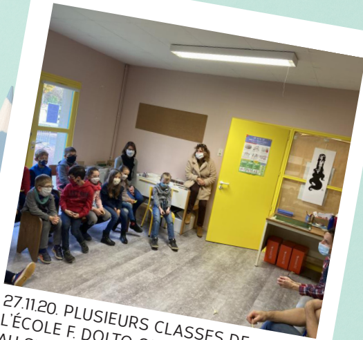
27.11.20. PLUSIEURS CLASSES DE L'ÉCOLE F. DOLTO ONT PU ASSISTER AU SPECTACLE « ELLE PAS PRINCESSE, LUI PAS HÉROS » SUR LE THEME DE L'ÉGALITÉ FILLES / GARÇONS.